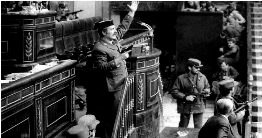
Teniente Coronel Antonio Tejero en el Congreso de los Diputados.