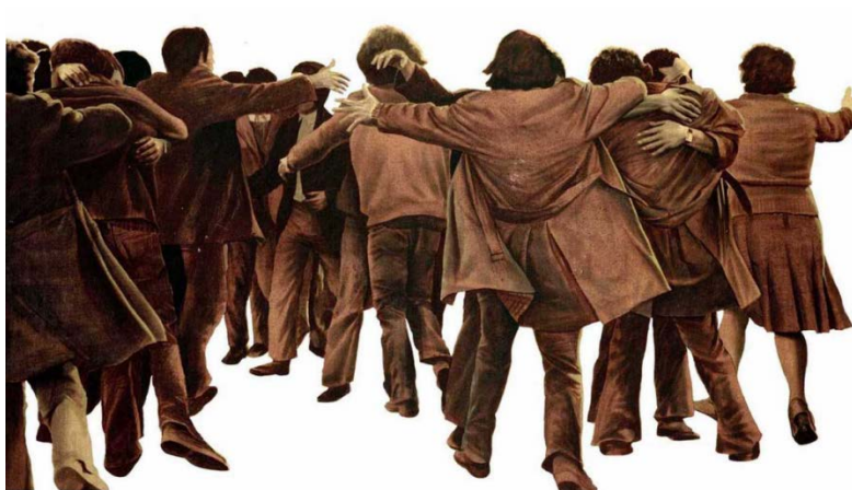
Cuadro El Abrazo , Juan Genovés.