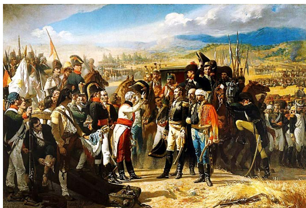
Cuadro. La rendición de Bailén . Autor: Casado del Alisal.